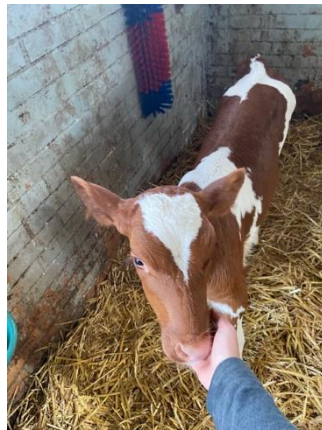
Das Kälbchen Ueli